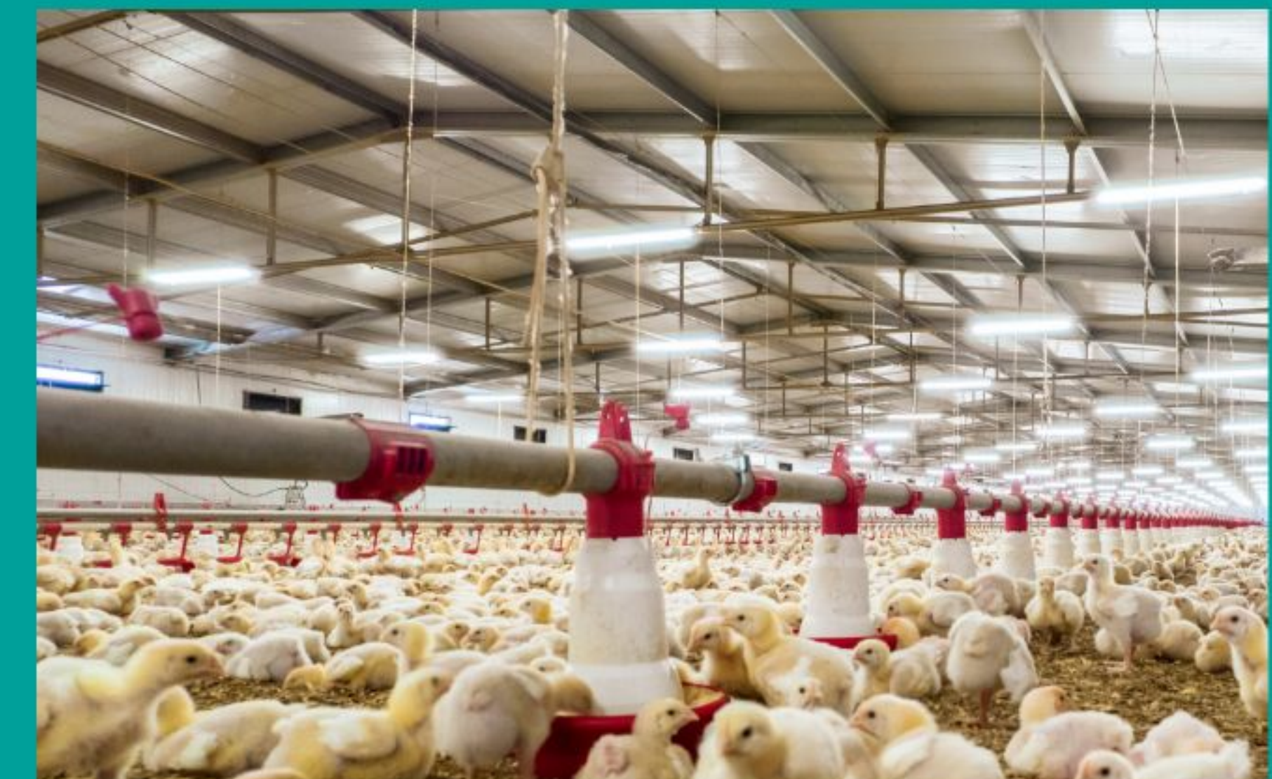
GALPÃO PARA AVICULTURA