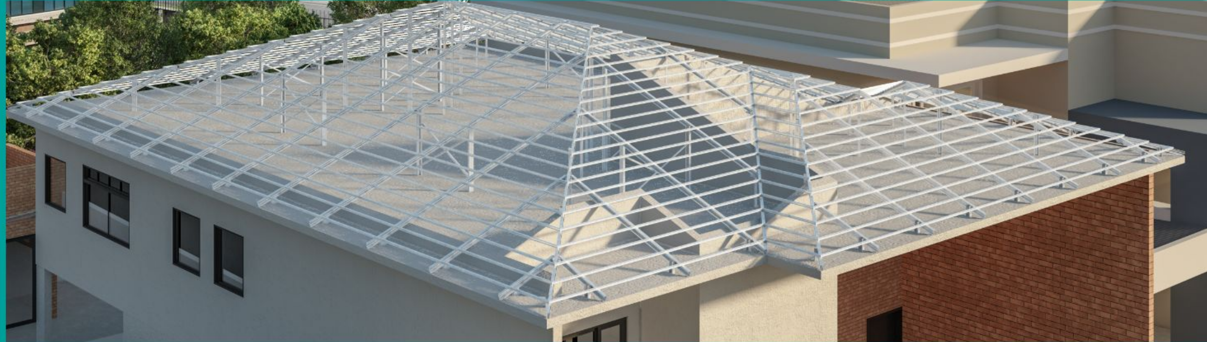
ESTRUTURA METÁLICA PARA TELHADO