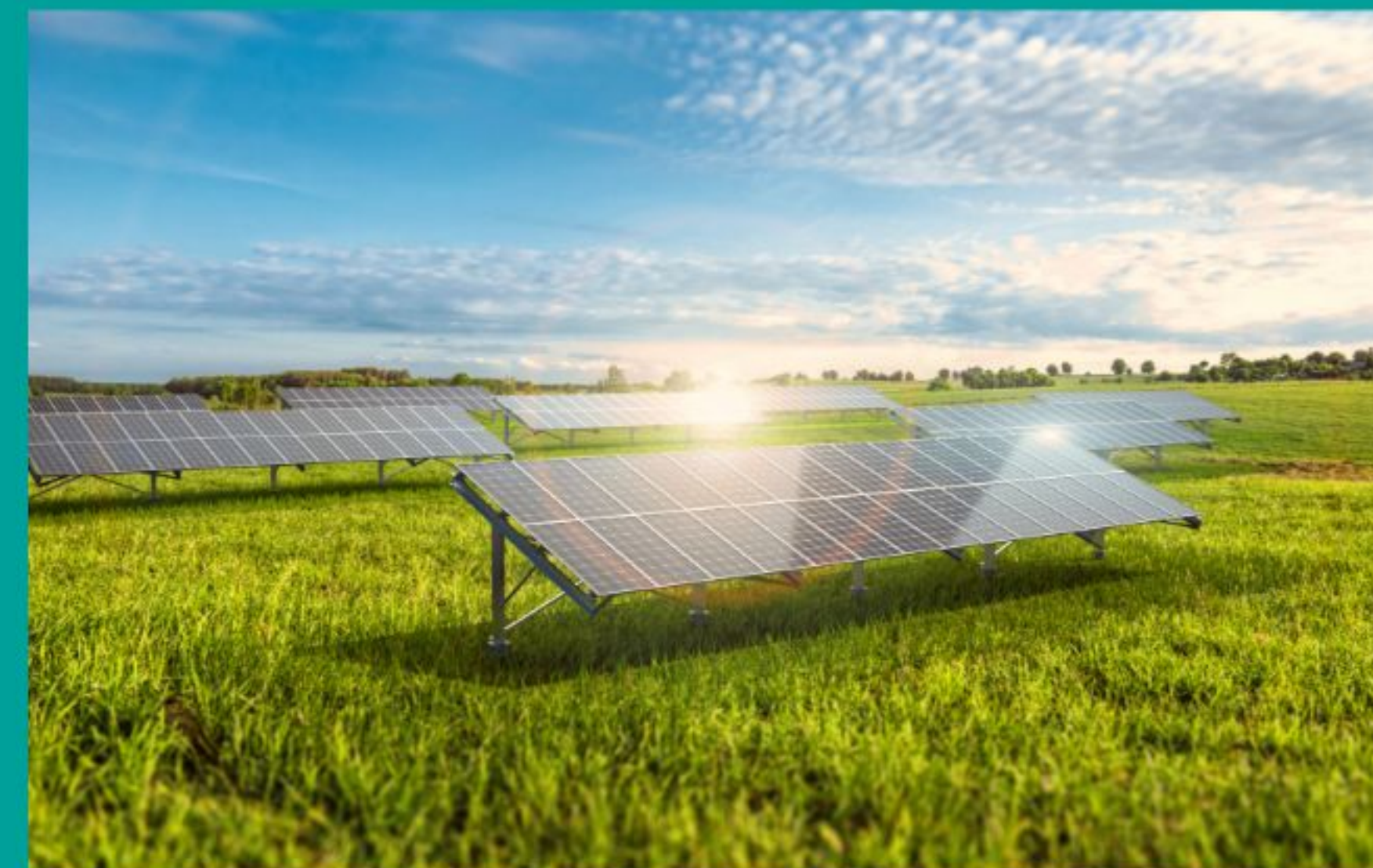
ESTRUTURA DE SOLO